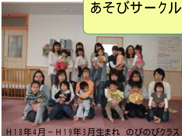
H18年4月～H19年3月生まれ のびのびクラス