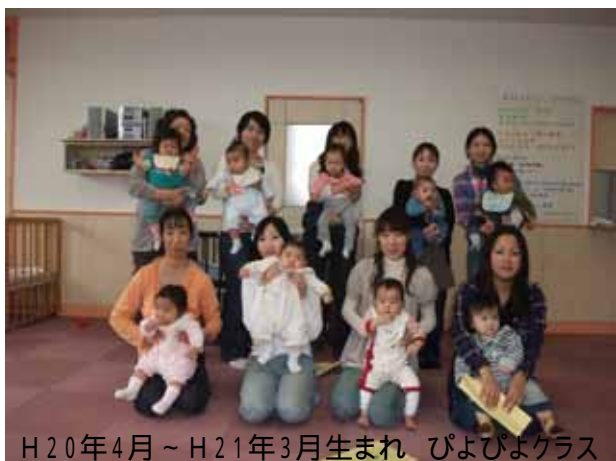
H20年4月～H21年3月生まれ ぴよぴよクラス